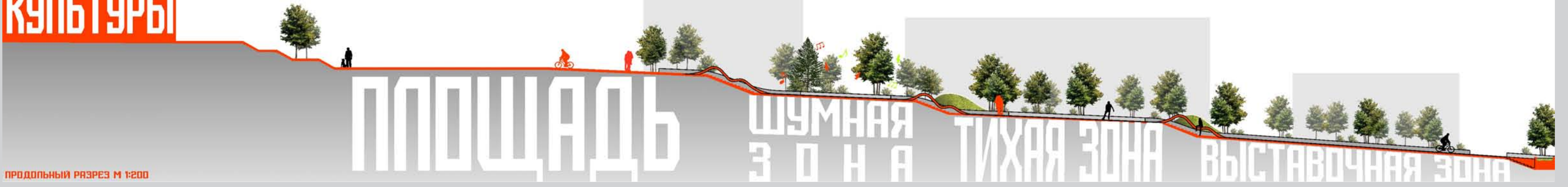
ПРОДОЛЬНЫЙ РАЗРЕЗ М 1:200